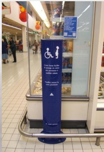
Fijado al suelo