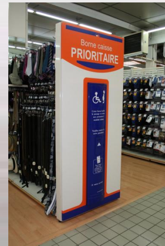
Integrados en un frontón